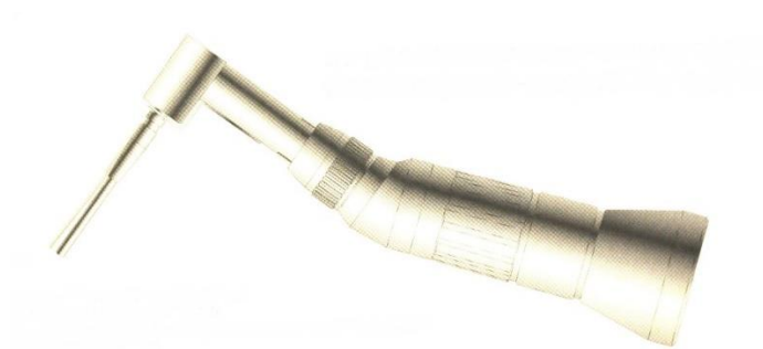
〈ハンドピースからの注水〉

東京審美会では、お薬を溶かすために製薬会社で製造された精製水を高圧蒸気滅菌して治療に使用しています。